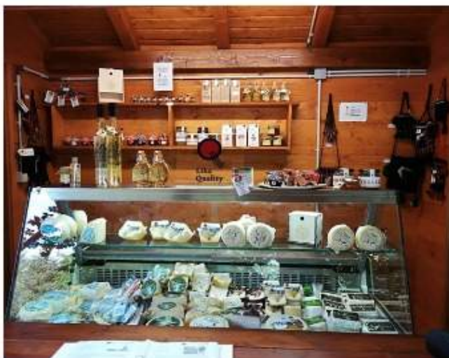
Zajedničko prodajno mjesto Lika Quality proizvoda, uspostavljeno u suradnji s Poljoprivrednom zadrugom Lika Coop u Nacionalnom parku Plitvička jezera

Common selling spot for the Lika Quality products, made in cooperation with the agricultural cooperative Lika Coop in the Plitvice Lakes National Park