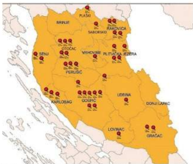
U Lika Quality sustavu nalazi se 37 proizvođača s područja Lika destinacije, koje obuhvaća dijelove Ličko - senjske, Karlovačke i Zadarske županije

Common selling spot for the Lika Quality products, made in cooperation with the agricultural cooperative Lika Coop in the Plitvice Lakes National Park